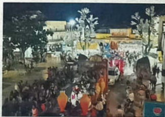
Las carrozas recorrieron las calles de Dalías.

● Los vecinos del pueblo y romeros ya desplazados disfrutaron del pasacalle en un viernes de música, color y alegría