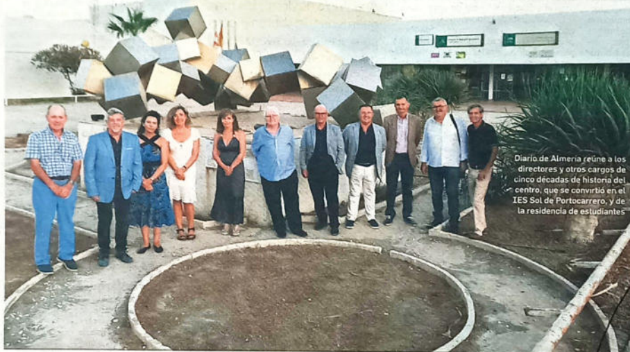
Diario de Almería reúne a los directores y otros cargos de cinco décadas de historia del centro, que se convirtió en el IES Sol de Portocarrero, y de la residencia de estudiantes

● Un centro pionero con equipamientos a la vanguardia y una arquitectura de referencia