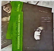
Catálogo de la exposición.