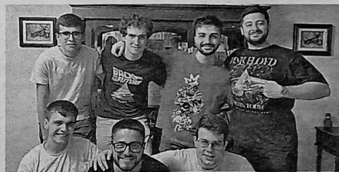
Equipo de la UAL participante en la Liga Matemática.

Durante esta liga, que tuvo su inicio en el mes de octubre de 2023 con la celebración de partidos semanales, las jornadas han tenido un desarrollo determinado en las que los equipos se enfrentaban en cada partido contra una universidad distinta, disputando un total de 16 encuentros en los