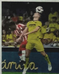
Ramazani pelea por una pelota.