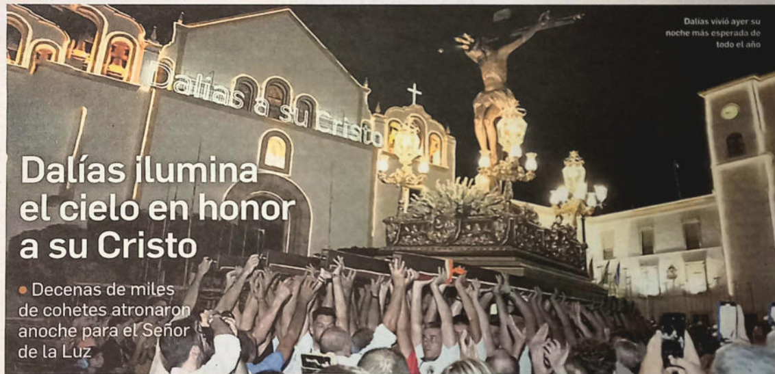
Dalías vivió ayer su noche más esperada de todo el año

12-13 UNA TRADICIÓN QUE REÚNE A MILES DE PERSONAS