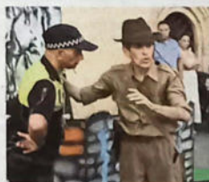
Actividad infantil en la capital.

Los niños se adentran en el cine con Indalecio Jones