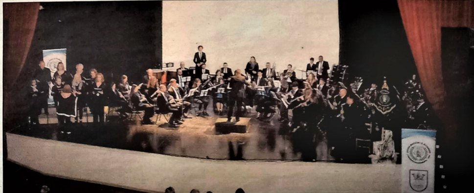
ACTO. La Unión Musical La Moraleja durante su actuación en Villanueva del Arzobispo.