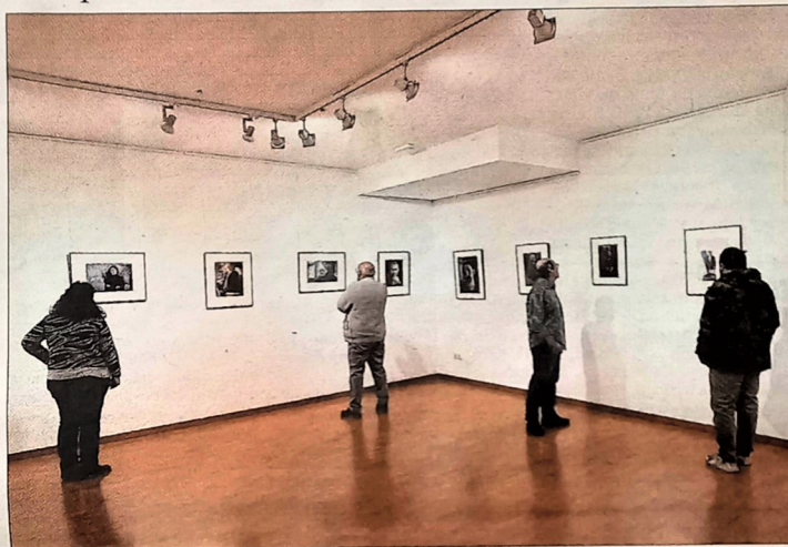
VISITA. La sala de exposiciones de la Biblioteca Pública Provincial.