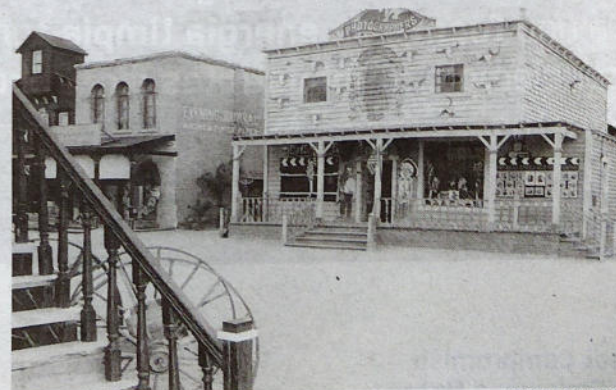
DIARIO DE ALMERÍA

pretendemos abrir de nuevo el museo en vivo para que grandes y pequeños conozcan a través de los campamentos, conferencias y recreaciones de actos históricos,