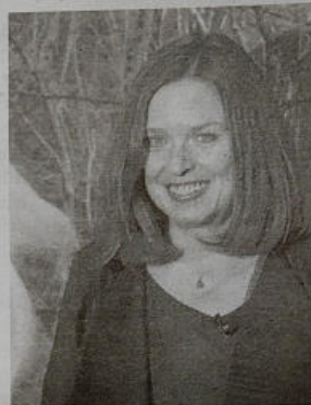
Ouka Leele.