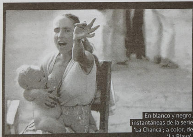
En blanco y negro, instantáneas de la serie 'La Chanca'; a color, de 'La Playa'.