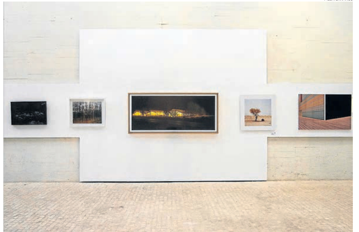
LA MOSTRA. Fins al 30 de juny es pot gaudir de les imatges d'aquest 30 fotògrafs que formen part del projecte.

El Museu de Belles Arts acull el treball de 30 autors joves